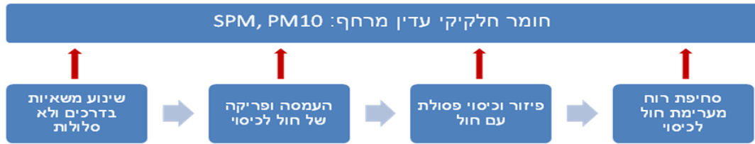
איור 1. מיפוי פליטות אבק וחלקיקים לא מוקדיות לאוויר

כתוצאה מהטמנת פסולת מעורבת ובוצה בעבר באתר לגמון ישנן פליטות של גז מטמנות. תאי הטמנת פסולת מעורבת עברו סגירה ושיקום כולל הקמת מערכת איסוף ביוגז ושריפתו בלפיד. מכיוון שכמות ביוגז וריכוז מתאן נמוכים הלפיד לא עבד במהלך שנת 2014 למעט הרצות. לפיכך ישנן פליטות נמוכות של גז מטמנות המורכב ברובו ממתאן ( CH_4 ) ופד"ח ( CO_2 ) ורכיבי קורט כגון H_2S , NMVOC ועוד.