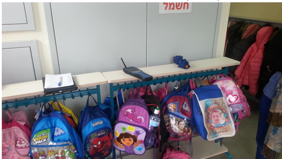
תמונה מס' 1 - מסדרון כניסה לגן