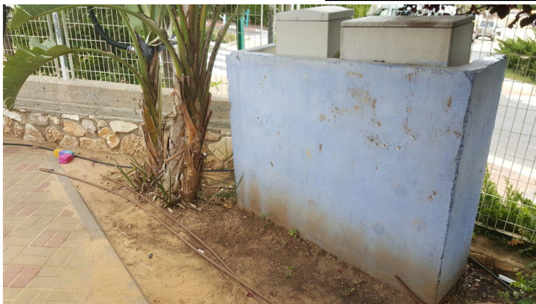
תמונה מס' 1 : ארונות חשמל בחצר הגן